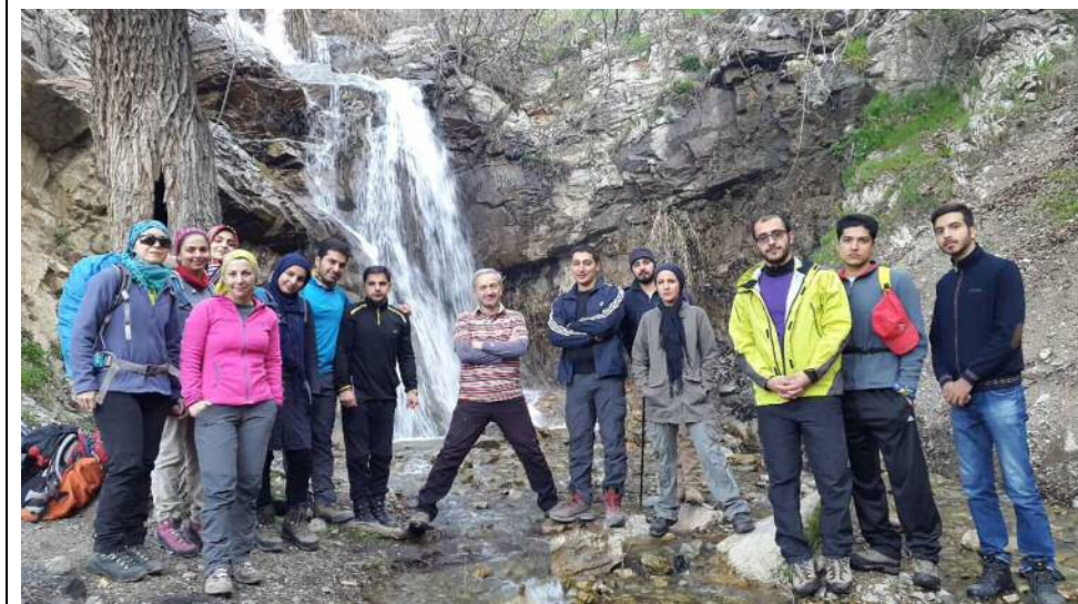
عکس های برنامه: